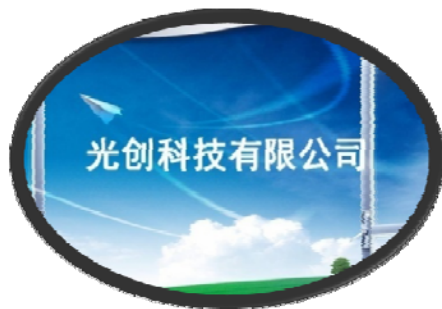
杭州市市科技节 测向仪组装供货 师生专利