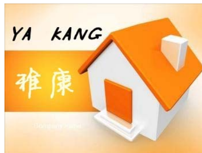
家庭空气检测治理 研发护肤品 经专业机构权威检测